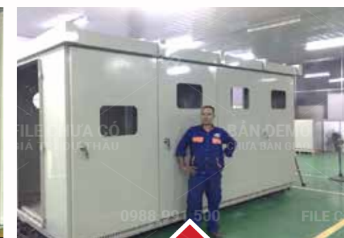
Cubic Electric box Cubic Electric box