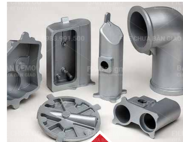
Thiết bị cơ khí (Thiết bị cơ khí)