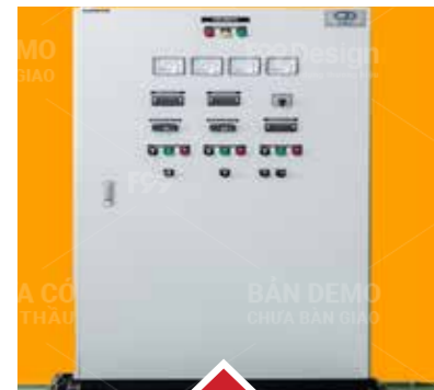
DB Panel DB Panel