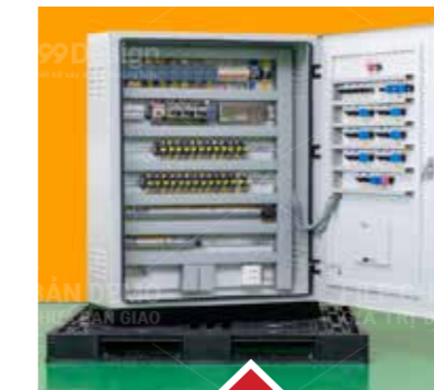
Control panel cabinet Control panel cabinet