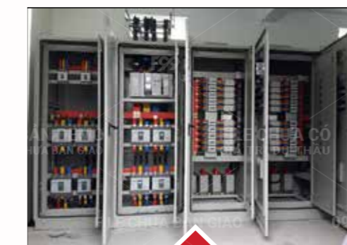
MSB Panel MSB Panel