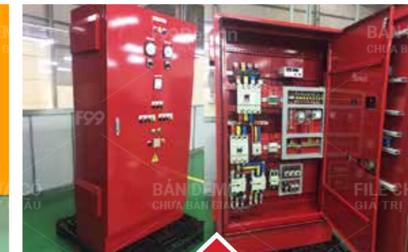
Fire Pump Control Panel Fire Pump Control Panel