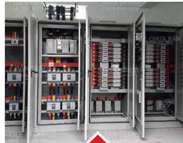
Thiết bị tủ điện (Thiết bị tủ điện)